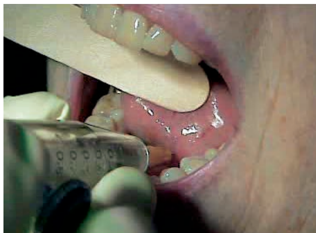
Рис. 1. Техника введения РФП в перитуморальную область.

скивания ротовой полости обычной водой пациент обследовался на гамма-камере с определением лимфатического дренажа в области головы и шеи. Сбор сцинтиграфической информации проводился как в динамическом, так и в статическом режимах через 1,5 ч после инъекции (10–20 тыс. имп. на кадр).