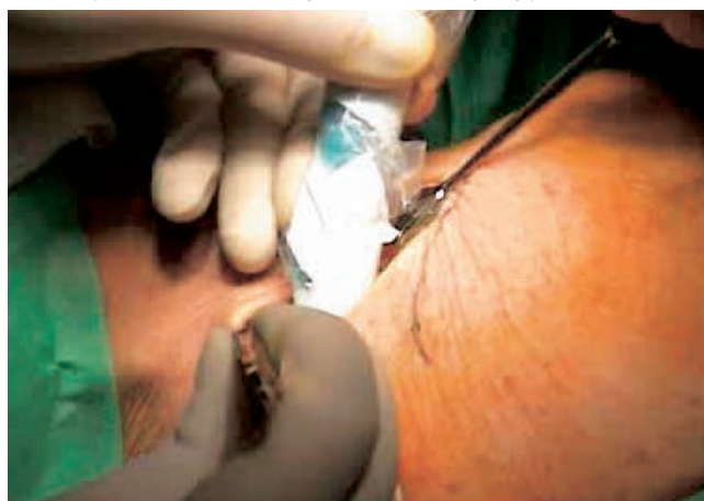
Рис. 4. Поиск СЛУ во время селективной операции: гамма-зонд вводится в микроразрез и детектирует максимальное излучение РФП, после чего участок ткани с максимальной активностью излучения иссекается.

стерильный пластиковый чехол. После удаления СЛУ проводилось экстракорпоральное измерение и данные излучения документировались, в виде скорости счета (количество импульсов в секунду). Если после