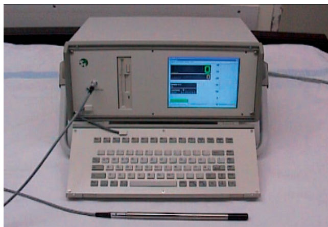
Рис. 3. Гамма-зонд для поиска СЛУ: переносный аппарат, регистрирующий гамма-излучение.

изотопной диагностики. При использовании минимально инвазивной методики (длина разреза для доступа не превышала 1–2 см) СЛУ определялись как путем поиска в операционной ране гамма-зондом, так с помощью увеличивающих линз в специальных хирургических очках. Врач радиоизотопного отделения присутствовал на операции с целью определения максимального излучения от СЛУ с помощью миниатюрного гамма-зонда диаметром 10 мм (SI Gamma Finder®, производства Silicon Instruments, Германия) (рис. 3, 4), конец которого запакован в специальный